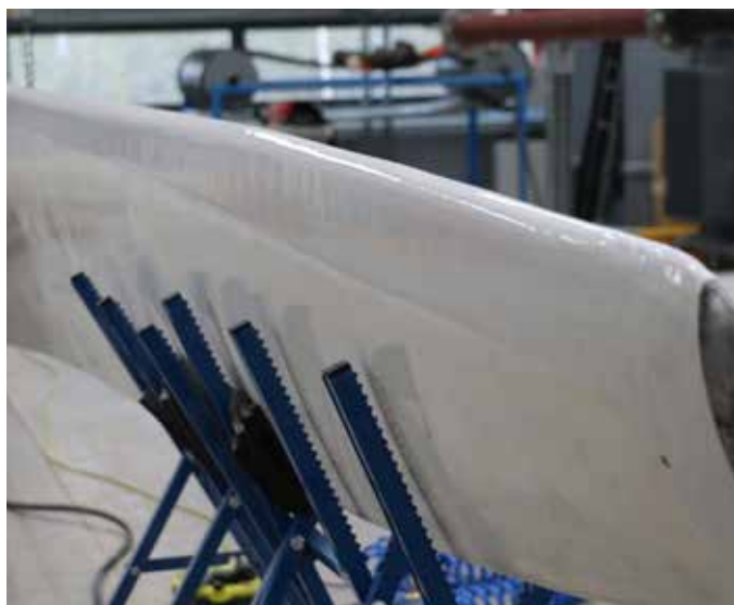
Belzona 5721 est disponible en deux couleurs, blanc et gris clair (RAL 7035)

Convient aux applications à des équipements similaires, dont les pales de ventilateur.