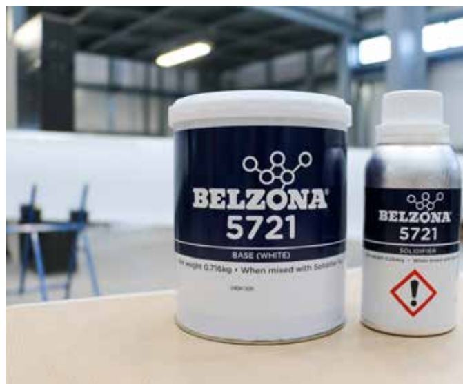
La taille de l'unité de Belzona 5721 est optimisée pour les applications sur site.

Pour plus d'informations, contactez votre représentant local Belzona :