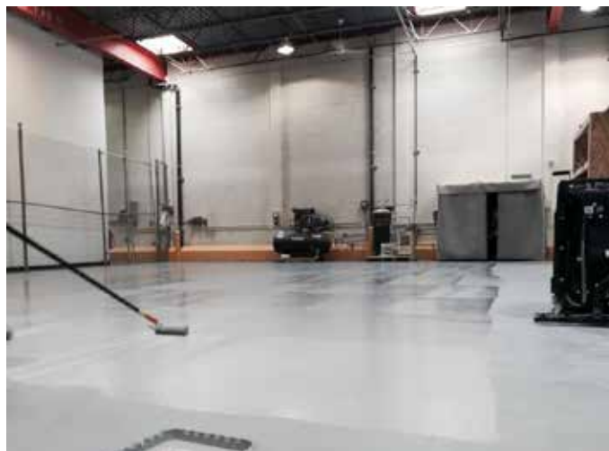
Belzona 5233 peut être appliqué manuellement sans difficulté, au pinceau ou au rouleau

Ce système sans solvant est facile à mélanger et à appliquer au rouleau ou au pinceau, sans travail à chaud.