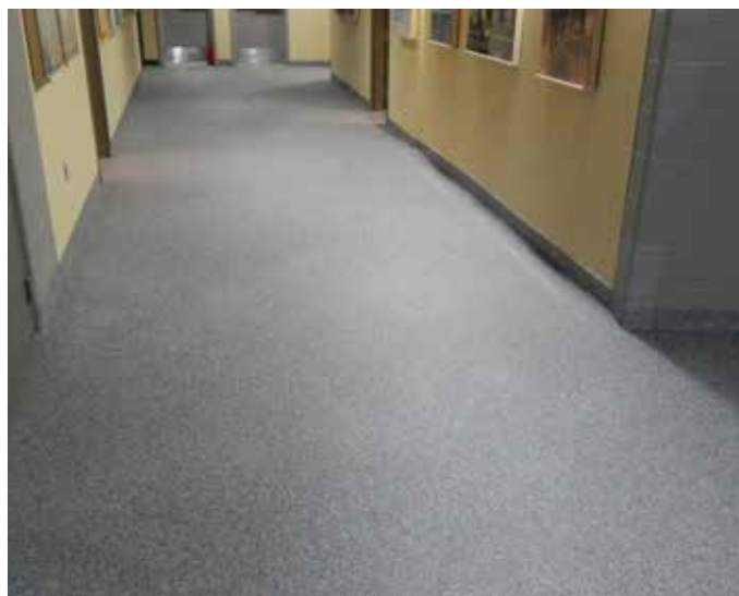
Il est utilisé comme couche de finition par-dessus Belzona 5231 avec des flocons de provenance locale.

Pour plus d'informations, contactez votre représentant local Belzona :