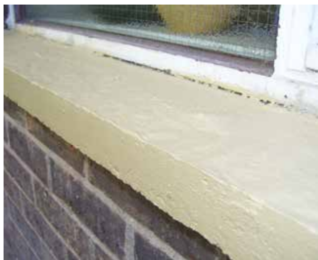
Belzona 5151 utilisé sur des appuis de fenêtre et des linteaux