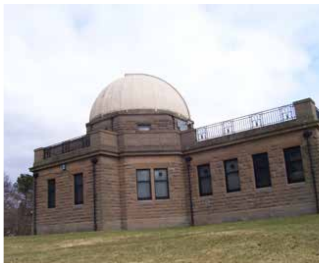
Belzona 5151 crée une finition esthétique

Pour plus d'informations, contactez votre représentant local Belzona :