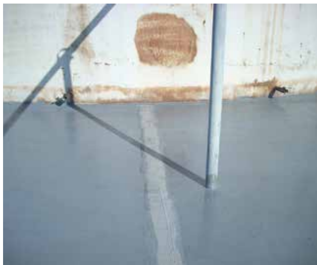
Utilisé pour reconstruire les joints endommagés dans les zones de confinement

Application manuelle sans travail à chaud ni outils particuliers pour réduire les temps d'arrêt.