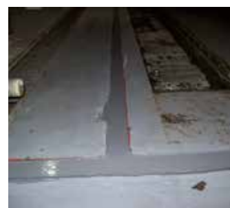
Réparé avec Belzona 4521

Pour plus d'informations, veuillez contacter votre représentant local Belzona :