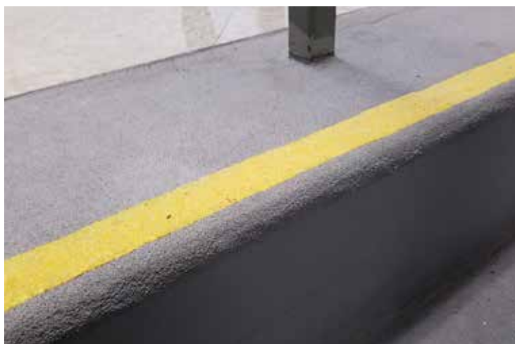
Détail de Belzona 4411 après plus d'un an en service

Ce système s'applique facilement à la brosse sans travail à chaud ni outils spéciaux.