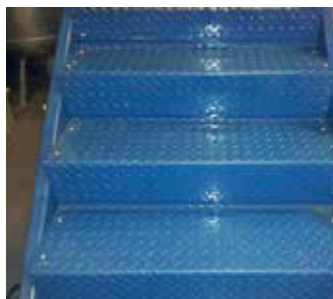
Escalier en métal avant application