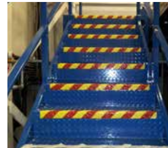
Escalier en métal après application