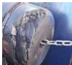
Pièce endommagée reconstruite