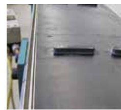
Matériaux différents liés par un joint étanche