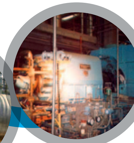
Bacs de condensat