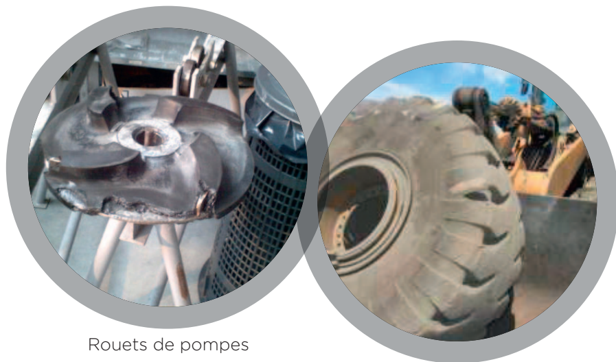
Rouets de pompes