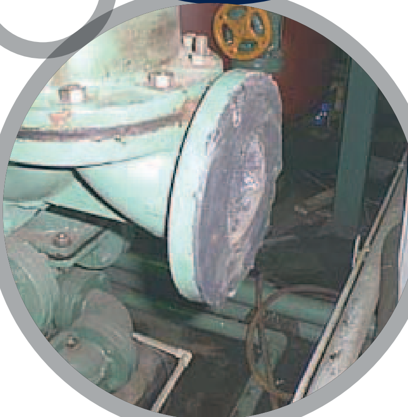
Revêtement de bride en caoutchouc

Pour plus de renseignements sur les produits Belzona, veuillez contacter: