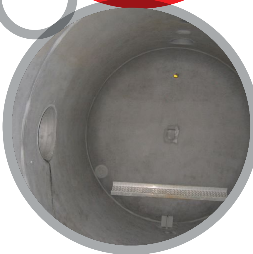
Ballons de torche

Pour plus de renseignements sur les produits Belzona, veuillez contacter: