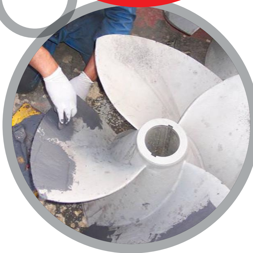
Rouets de pompes

Pour plus de renseignements sur les produits Belzona, veuillez contacter: